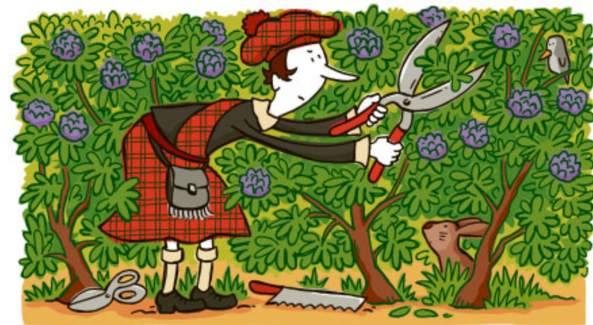
Illustration: Charlotte Winger

Eine echte Bedrohung sind Neophyten in Deutschland nicht. Das sieht in anderen Gegenden der Welt anders aus. Die Waldrebe Clematis vitalba beispielsweise, die hübsche Blüten trägt, erstreckt in Neuseeland ganze Baumbestände. Es gibt aber auch Neuseeländer, die den „Old Mans Beard“ dekorativ finden. Und im Nationalpark Snowdonia fragen Besucher regelmäßig, ob sie Ableger haben können von dem Rhododendron, der sich so schön vermehrt.